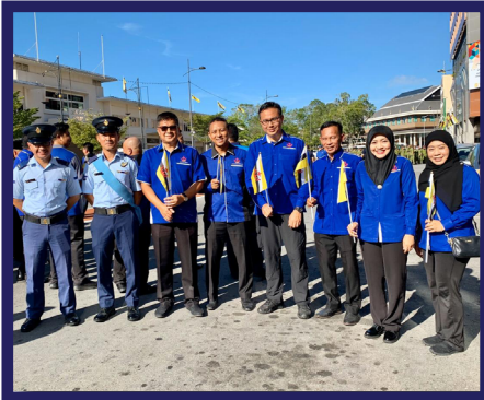
BANDAR SERI BEGAWAN, Ahad, 23 Februari 2020

Seperti lazimnya, pegawai dan kakitangan di Jabatan Pendidikan Kokurikulum telah terlibat dalam acara yang berlangsung sepanjang sambutan hari kebangsaan Negara Brunei Darussalam yang ke-36 Tahun.