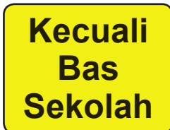
Tanda masuk kebenaran hanya untuk bas sekolah