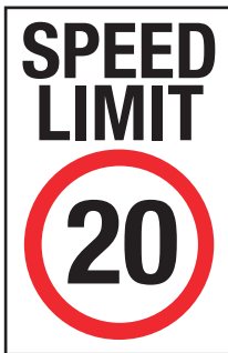
Tanda had kelajuan