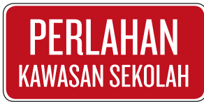
Perlahan / Kawasan Sekolah