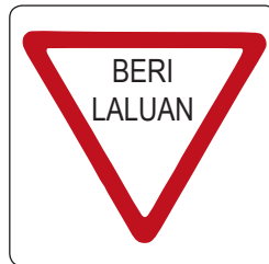
Isyarat beri laluan