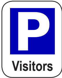
Letak kereta untuk pelawat