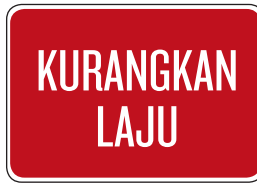
Isyarat kurangkan laju