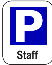
Letak Kereta untuk Guru-Guru & Kakitangan