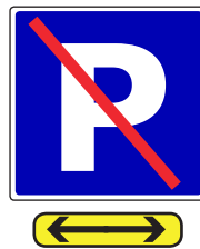
Bukan Tempat Letak Kereta