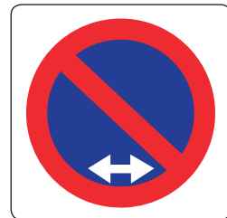
Tidak dibenarkan menunggu