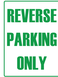
Tanda meletakkan kereta secara Reverse Parking