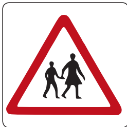
Awas Laluan Pejalan Kaki