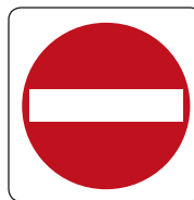
Tidak dibenarkan masuk