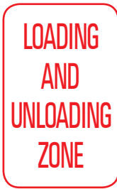
Tempat Pemungghahan Barang