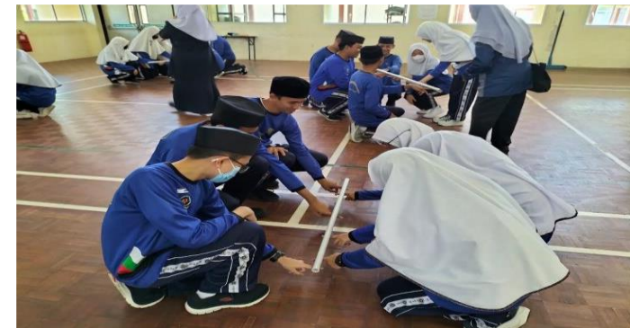
Aktiviti Sepanjang 6 Hari