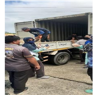
Penghapusan Harta Benda Kerajaan dibuat oleh SR OKPB Bukit Sawat di tapak penghapusan Sg Paku, Tutong.