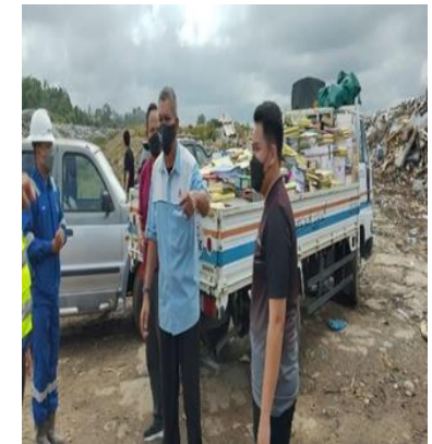
Penghapusan Harta Benda Kerajaan dibuat oleh Jabatan Sekolah-Sekolah di tapak penghapusan Sg Paku, Tutong.