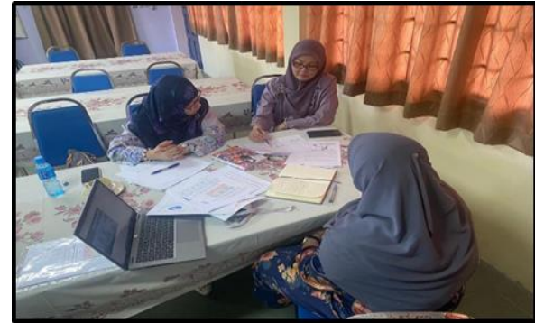
Lawatan Pemantauan Dan Penilaian Peringkat Perancangan (Planning Stage) SR Sungai Tali – 15 Februari 2023