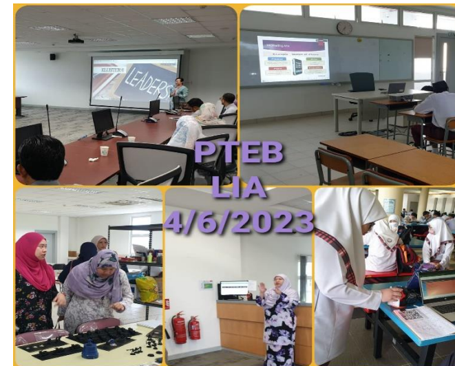
Pusat Tingkatan Enam Belait - 4 Julai 2023