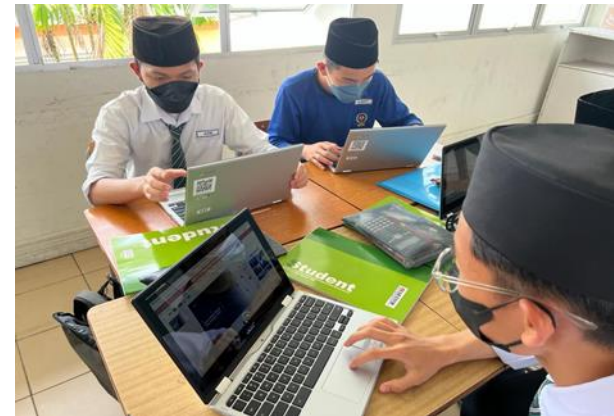
'Blended Learning' - SM Perdana Wazir

Para pelajar digalakkan membawa peranti IT seperti laptop / ipad / telefon bimbit dengan kebenaran pihak sekolah untuk menyokong blended learning dalam pengajaran dan pembelajaran.