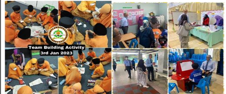
Lawatan Pemantauan Kesiediaan Pembukaan Sekolah Di Sekolah-Sekolah Kluster 6

Semasa lawatan kerja, pemimpin sekolah juga berpeluang untuk menyuarakan mengenai isu dan cabaran mereka kepada pegawai-pegawai kluster yang telah diaturkan mengikut zon semasa lawatan. Sehubungan dengan itu, pegawai pihak kluster akan berbincang dengan Ketua Kluster untuk membantu sekolah dengan merujuk kepada bahagian-bahagian yang tertentu di Kementerian Pendidikan serta mencari penyelesaian kepada setiap permasalahan sekolah.