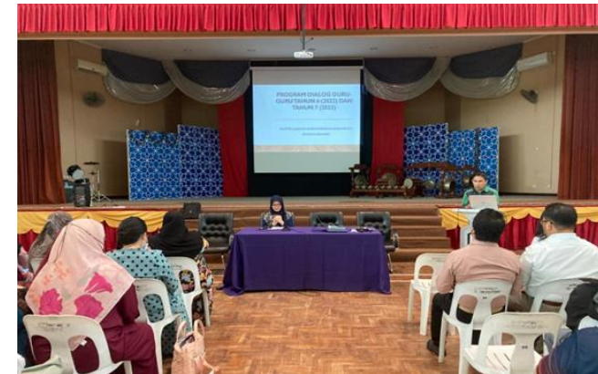
Perkongsian Dari Wakil Kluster 6

Acara di akhiri dengan guru-guru Tahun 6 (2022) bermuzakarah bersama guru-guru tahun 7(2023) mengikut subjek yang diajar semasa Tahun 6 (2022).