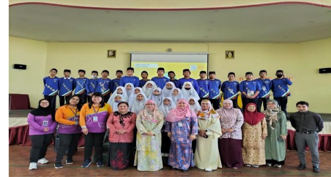
SMPW NXplorers Projek kolaborasi diantara K6, JSS Bersama dengan BSP dan SEL

Program 3P's 21st CLD NXplorers telah mencapai objektif iaitu meningkatkan kompetensi dan kemahiran '21st Century Learning Skills' dikalangan pelajar. Ini dapat dilihat daripada maklum balas yang diberikan oleh penuntut dimana mereka berpendapat bahawa melalui program ini ianya telah mempertingkatkan kemahiran Kominikasi (37%), Berfikir Secara Kritis (29.6%) Kreativiti dan Penyelesaian Permasalahan (11.1%).