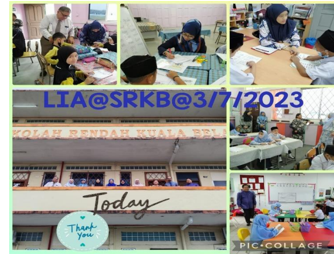
SR Kuala Belait - 3 Julai 2023