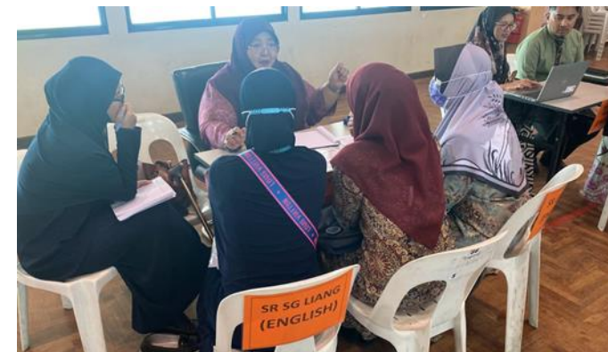
Muzakarah Bersama Guru Tahun 7