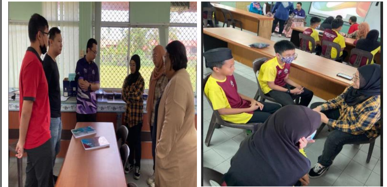
Sesi Muzakarah pemimpin sekolah, guru-guru dan pelajar-pelajar bersama sukarelawan-sukarelawan BSP diadakan pada 4 Mac 2023 di Sekolah Rendah PSN Pg Mohd Yusof.