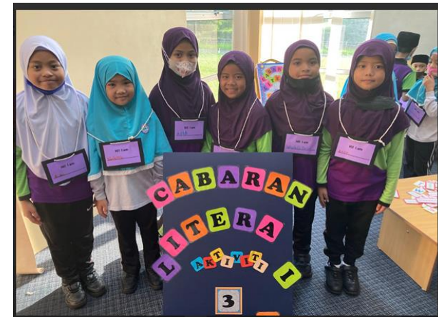
Aktiviti bagi Cabaran Literasi