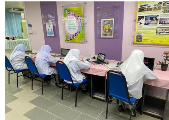
Pelajar-pelajar hostel menghadiri pembelajaran secara online di bilik perpustakaan SM PJN Pg Hj Abu Bakar