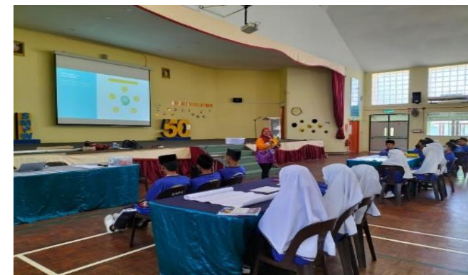
Pembentangan bagi Isu-Isu yang melibatkan FEWE