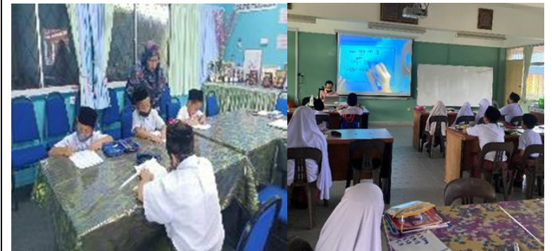
Lawatan Pemantauan Dan Sokongan Ke Sekolah-Sekolah Kluster 6